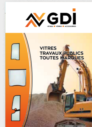
Vitres travaux publics