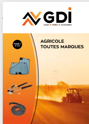
Vitres agricoles | Tomes 1 et 2